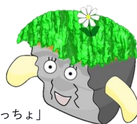
公式マスコット キャラクター「いわっちょ」