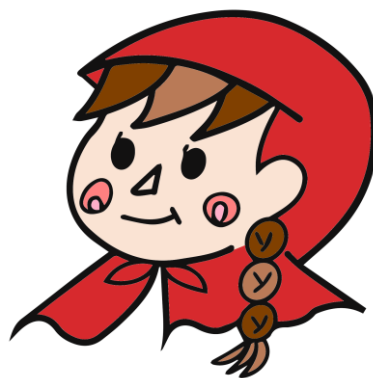
大会公式キャラクター：オリビアちゃん