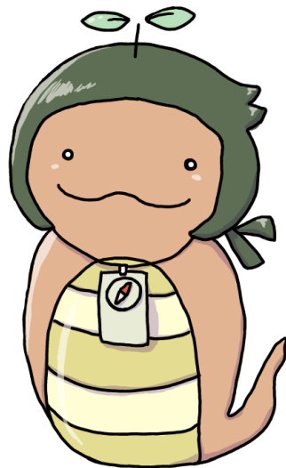
大会公式マスコット