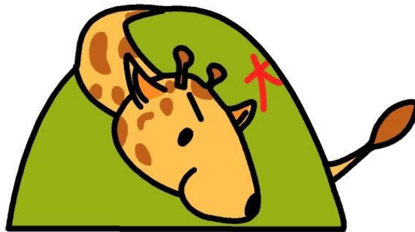
大会公式マスコット おねぎりん